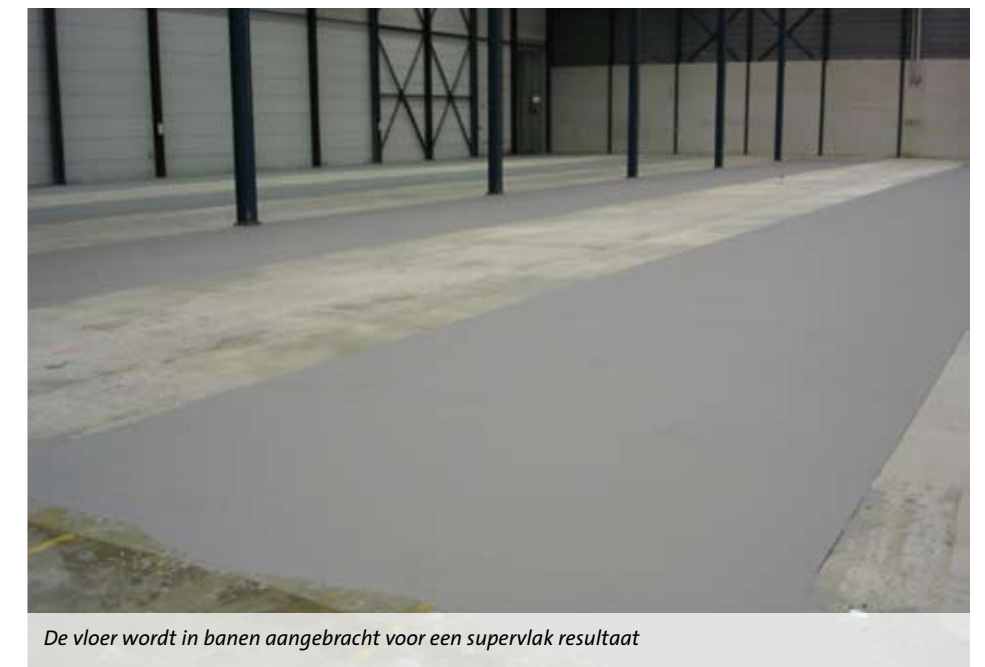
De vloer wordt in banen aangebracht voor een supervlak resultaat